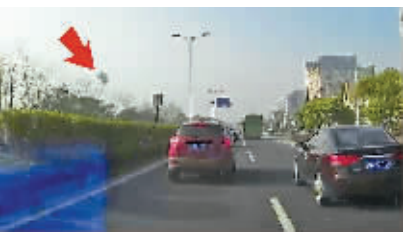
(记者 洪茜茜 整理)

#您播报# @Frank-夏：强烈谴责乱丢垃圾的私家车主，不顾他人的安全，随意乱扔垃圾！