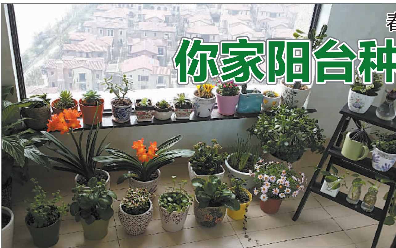
盆盆新绿绽放春意。