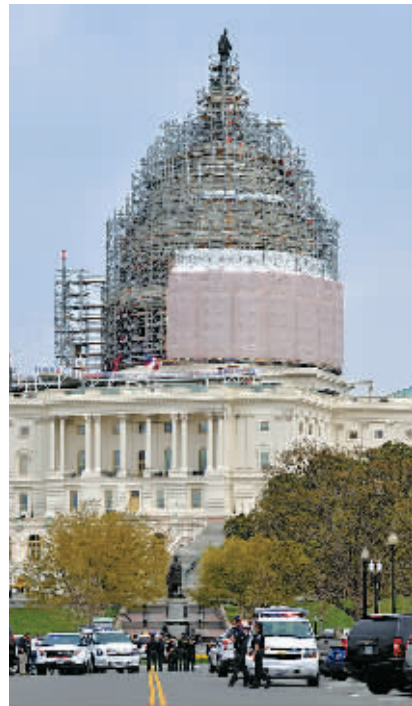
▲警察封锁附近道路。