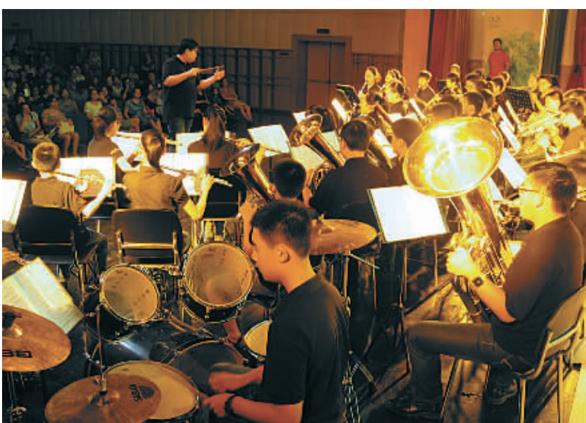
图为宁波市学生艺术团交响乐团正在紧张地排练。

说起青少年宫公益社团，故事得从26年前说起。1989年，我市成立了由团市委和市教育局共同主办的宁波市学生艺术团，下设舞蹈团、交响乐团、民乐团、主持表演团、合唱团等5个分团。随后，宁波市红领巾社团，英语、文学、书法、国画、五子棋、巧红帮、航模、才艺表演等学科社团，天文爱好者协会、风筝协会、青年合唱团、青年教师室内乐团、亲