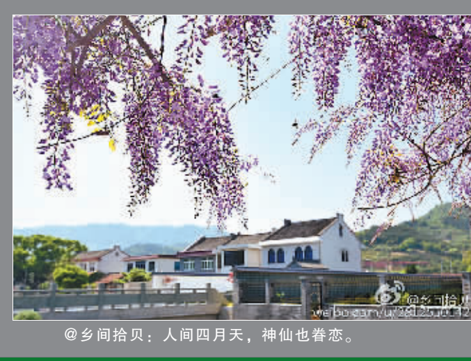
@乡间拾贝：人间四月天，神仙也眷恋。