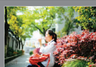
@Dom译：慈湖中学，这里有我最青涩的青春。