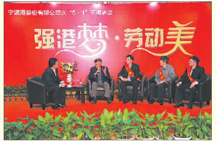
宁波港集团举行庆“五一”劳模访谈活动。