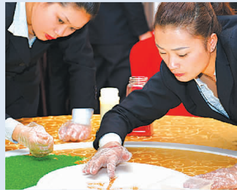
石浦大酒店创新管理，将服务做到极致

清洁生产审核的企业。 重视产品研发和技术创新，先后开发出4大系列300多个新品种，雪菜大汤黄鱼获得中国餐饮业博览会最高奖“金鼎奖”，石浦海鲜咸蟹、苔菜小烤等进入中华名菜名点。 打造从田头到餐桌的一站式绿色供应链，在四明山建立绿色养殖基地，在石浦建立水产养殖基地，与千禧海鲜公司合作，开展供应淡水鱼等。 开展宴会管家式全程跟踪服务、婚庆一对一服务、主题宴会VIP接待服务，增设儿童乐园、婴儿休息室、平价超市，满足顾客个性化、差异化需求。 积极拓展营销渠道，通过大众点评、美团网、微信等收集顾客信息，与银行、旅游、婚庆等联盟营销网络合作，优化顾客体验，积极转型升级。