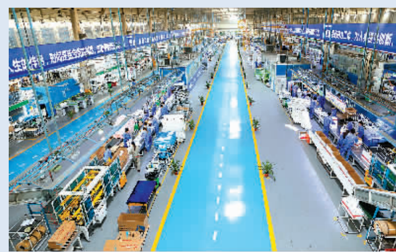
奥克斯智能化工厂，极大提高了生产效率

建立全面、有效的服务体系，推出5A服务、空调十年免费包修等举措，开通400服务热线，提供微信、网站报装、报修功能，换季前免费清洗、保养等服务。从共同客户处获得竞争对手的顾客满意度对比信息法，有针对性地改进产品和服务质量。 基于“人对了，企业就对了”的人才理念，公司成立了奥克斯内部学院，设立了内部讲师制度，根据不同层级，设立A系列培训计划、营销精英班、内部讲师团队等专项提升培训项目。通过KPI考核、360度考评、工作述职等多种方式进行绩效考核。 设定智能化工厂建设目标，近三年投入3300余万元建成并投用了ERP、SRM、OMS、CSS、CRM、PDM、HER、浪潮资金管理系统等。制订严格的财务管理制度和风险控制体系，滚动锁定五年资金需求，通过与银行合作，有效保障资金体系运作通畅，确保经营稳定性。通过竞品对比、自身产品研发创新和采购物料定价机制与规模达到成本控制。