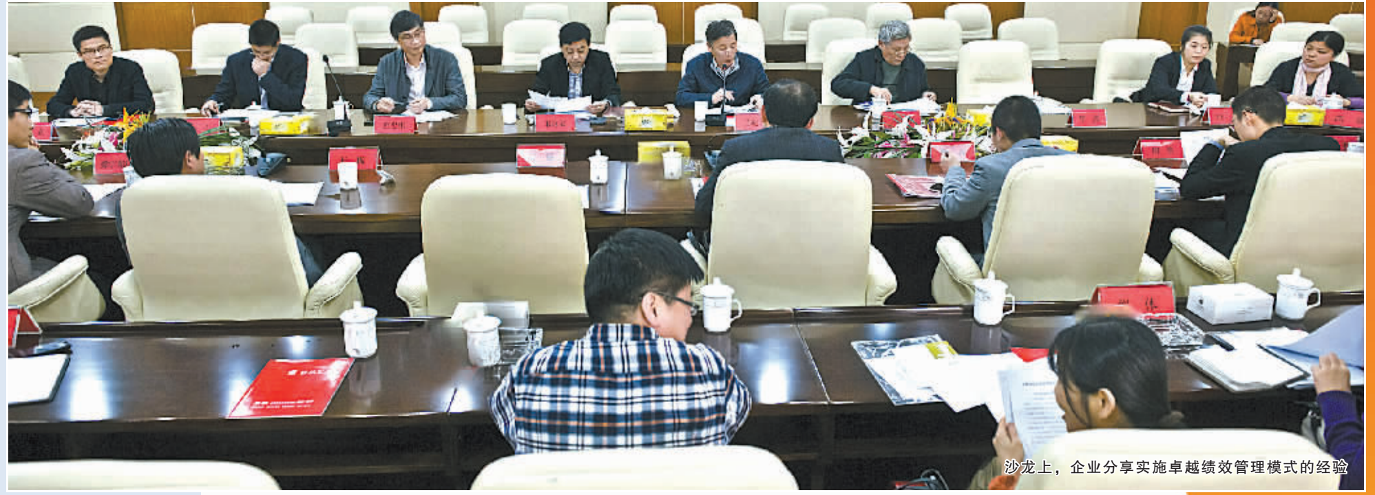
沙龙上，企业分享实施卓越绩效管理模式的经验

2014年度宁波市市长质量奖确定，一批追求卓越的企业，在经历了坚持不懈的努力后，在这个展示实力的舞台上，领取属于它们的荣誉。 2006年，在市质监局的推动下，我市成为全国第二个设立市长质量奖的城市，9年来，市长质量奖就像一把高擎的火炬，引导着志存高远的优秀宁波企业，不断路上追求卓越征途。 近年来，随着经济结构的调整和外发展环境的变化，内涵式发展成为越来越多宁波企业的新追求。为更好地引导企业经营创新，2013年开始，我市在全国率先设立政府质量发展专项资金，出台“三免一补”政策，每年投入近1000万元用于卓越绩效管理模式推广，鼓励广大企业全面提升经营管理水平。 我市导入卓越绩效管理模式的企业超过300家，在卓越绩效模式的带动下，企业战略决策多了集体智慧，内部管理“对标”条理化，市场开拓更具主动性，企业内涵发展模式更具活力。 市长质量奖引导企业提升发展质量，促进企业做大做强，正为推进“质优宁波”建设发挥巨大作用。 目前，全市已有183家企业获各级政府质量奖，其中1家企业获中国质量奖提名奖，2家企业获浙江省政府质量奖，1家企业获浙江省政府质量奖提名，246家企业建立了首席质量官制度，1124家企业建立质量损失率统计制度。