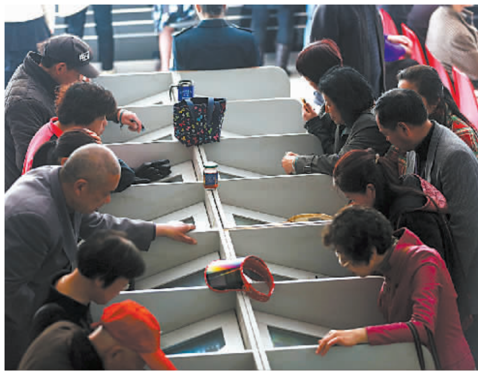
4月23日，股民在江苏南通一证券营业厅关注股市行情。

财政部23日发布消息，根据《国务院关税税则委员会关于调整部分产品出口关税的通知》，自2015年5月1日起，我国将取消钢铁颗粒粉末、稀土、钨、钼等产品的出口关税，对铝加工材等产品出口实施零税率。（均据新华社）