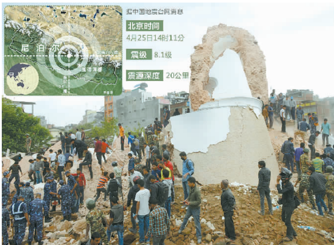
4月25日，在尼泊尔首都加德满都，救援人员在一处废墟上工作。