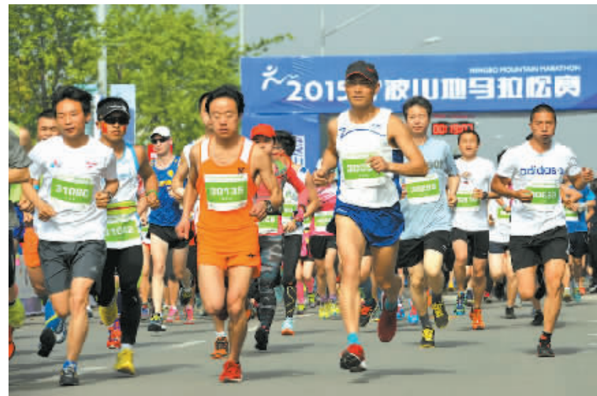
山地马拉松比赛现场。