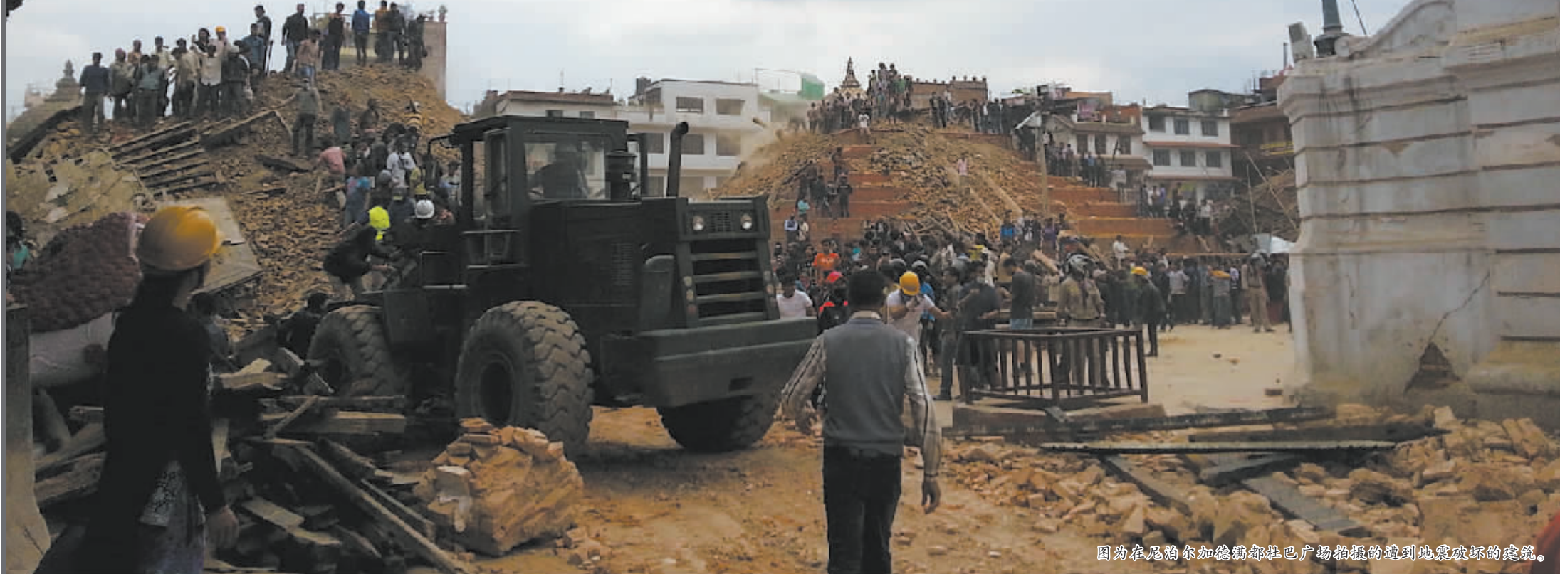
图为在尼泊尔加德满都杜巴广场拍摄的遭到地震破坏的建筑。

尼泊尔25日发生强烈地震,随后发生多次余震,尼警方最新消息说已有1100多人遇难。印度、孟加拉国、中国西藏等地损失严重。