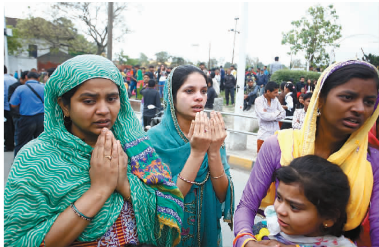
4月25日,在尼泊尔首都加德满都,人们在地震后祈祷。

智利中南部边境地区的卡尔布科火山22日突然喷发,智利政府随后宣布火山所在区域进入紧急状态,警方对火山周边20公里内居民进行紧急撤离,目前撤离人口超过4000人,有1人失踪。(新华社/法新)