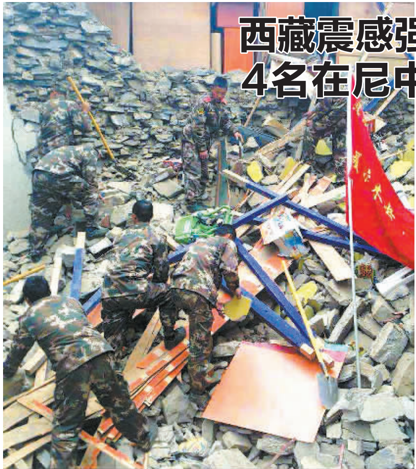
4月25日,武警西藏总队聂拉木中队官兵在聂拉木县展开救援(手机拍摄)。

另据路透社援引尼泊尔旅游部门官员的话报道,雪崩发生时,处在基地和正在攀登的登山者至少有1000人,其中大约400人是外国人。眼下,基地大本营的两个帐篷已经挤满伤员,“伤亡数字可能继续上升,或许还包括外国人”。