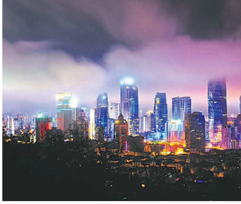
4月28日在青岛拍摄的平流雾中的城市夜景。