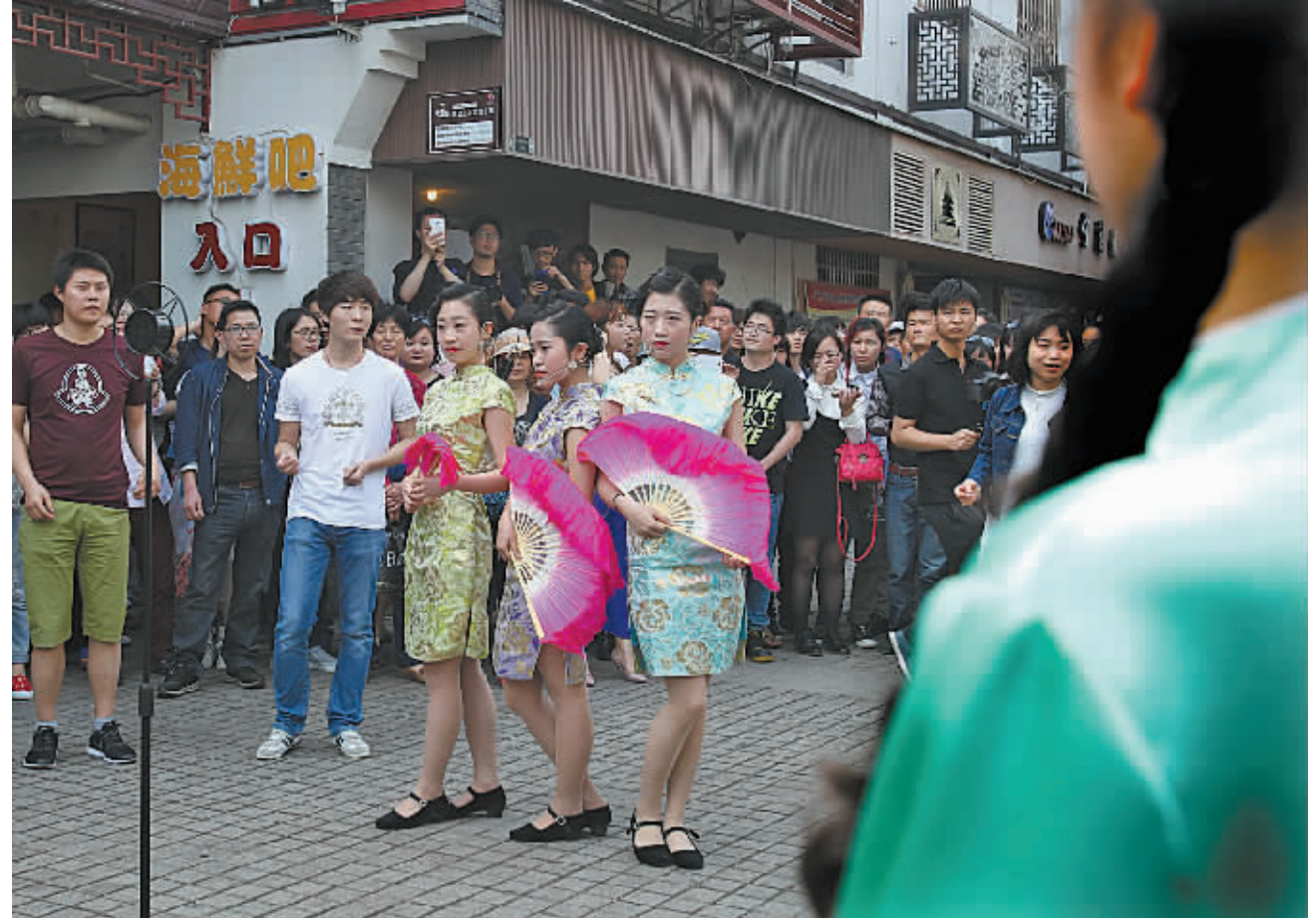
鼓楼沿“闪现”民国往事 昨日下午，40余名公益快闪族身着民国服饰，在鼓楼沿呈现了一段民国往事。图为节目尾声一曲载歌载舞的《月半小夜曲》，给游客带来了欢乐。