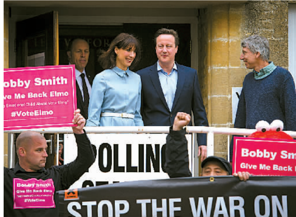
5月7日,在英国威特尼,英国首相、保守党领袖卡梅伦(右二)与夫人(右一)在一处投票站投票后离开。 英国2015年议会选举7日拉开帷幕,选举将产生议会下院的650名议员。此前主流民调显示,传统大党保守党和工党支持率不相上下,本次大选可能再度产生一个“无多数议会”。

中的一个组建少数派政府。 伦敦政治经济学院教授托尼·特拉弗斯预测,今后可能出现多党政府,其稳定性将不如2010年开始执政的保守党和自由民主党联合政府。 可能联手 两大党轮流执政本是英国的政治常态,直到2010年大选时才出现了二战后第一个两党联合执政的政府。那场选举后,就有分析人士预测,今后政党间“联姻”将成为“家常便饭”。 鉴于本届选举结果难料,英国各党派已经就联合执政前景纷纷表态。 致力于推动苏格兰独立的小党苏格兰民族党预计会赢得苏格兰地区大部分选票。这一党派已表态将支持工党领导的少数派政府,而非保守党。只是,工党领袖米利班德排除了与苏格兰民族党联合执政的可能性。 保守党一方则有可能再度与自由民主党联手。现任首相、保守党领袖戴维·卡梅伦在接受英国广播公司采访时承诺,他将“把国家放在第一位,我所能做的就是提供一个强大稳定的政府”。 不过,自由民主党一方并没有“绑定”保守党,党派商务秘书文塞·凯布尔在接受《每日邮报》采访时对与保守党再次联合执政的前景略显“迟疑”。他认为,卡梅伦所提在2017年就英国是否退出欧盟举行公投是“非常糟糕的主意”。