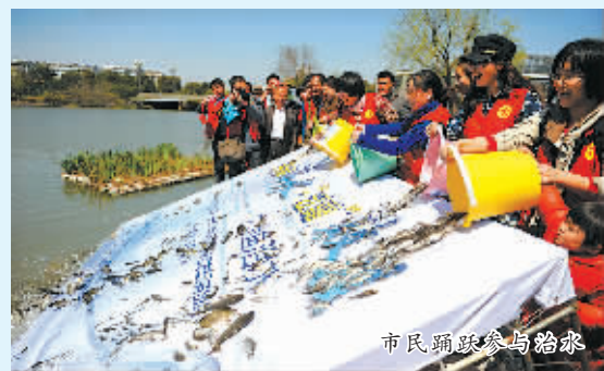
市民踊跃参与治气