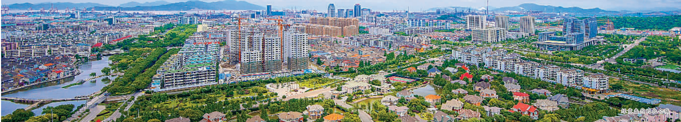
绿意盎然的北仑城

空气质量优良率84.4%，居全市前列；捧获浙江省“五水共治”最高荣誉“大禹鼎”、全省首批“清三江”达标县（市）区，荣获宁波市治水唯一“金奖”；成功创建省森林城市；荣获全国生态工业示范园区称号；国家级生态街道（镇）全覆盖……昨天，北仑正式迎来国家级生态区建设验收。