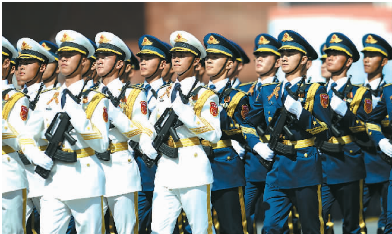
5月9日,在俄罗斯首都莫斯科红场,中国人民解放军三军仪仗队方阵行进在阅兵式上。