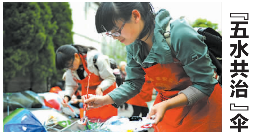
「五水共治」伞上画 昨天，江东东胜街道庆安社区举行“五水共治”宣传活动，来自我市高校的环保志愿者在透明雨伞上绘制以“水”为主题的漫画、宣传画、装饰画，并将雨伞赠给社区居民。

注册资本实缴认缴，实收资本不作为登记事项，所有公司制企业免收验资报告、取消非货币出资比例限制……去年3月实施的商事制度改革，有效降低了小微企业投资创业成本，我市商户“个转企”和企业品牌建设热情高涨。统计数据显示，2011年至2013年全市新设企业户数呈波动起伏状态，但从去年开始企业不再畏手畏脚，敢于增资创业。今年1月至3月，全市新增注册资本890.5亿元，较2011年增加了725亿元。企业户数均资本急剧扩张，从5年前的286万元增长至1075万元，企业