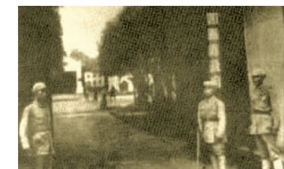
人民解放军接管国民党鄞县县政府