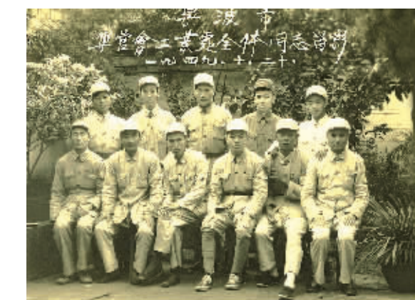
宁波市军管会工业处全体同志合影