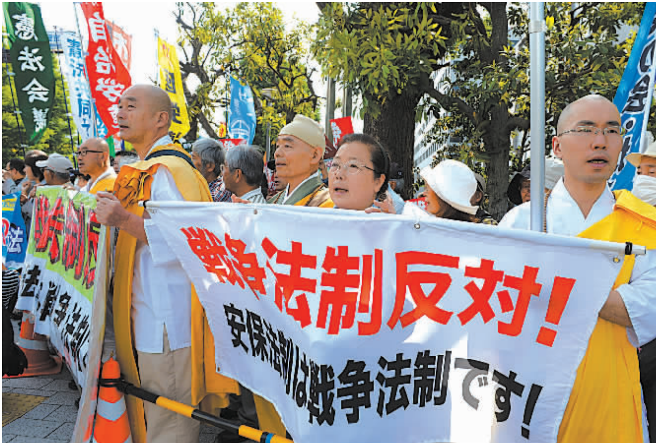
5月14日,在日本东京首相官邸前,日本民众手举标语抗议内阁执意通过行使集体自卫权相关安保法案。

“现在日方提出把相关工业遗址申报列入世界遗产名录,却无视其中存在的强征劳工问题,将向国际社会发出什么样的信号,值得深思。”华春莹说。