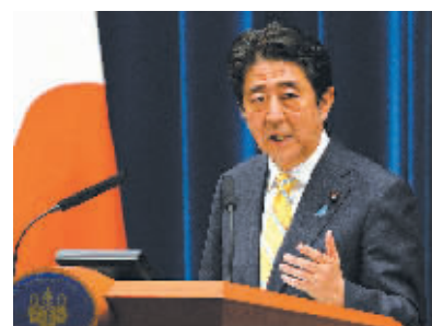
安倍晋三就内阁通过一系列安保相关法案举行记者会。

《朝日新闻》5月初公布的一项民调显示,近九成日本民众担心,随着日本自卫队扩大对美军等其他国家军队的军事支援,日本今后会卷入战争。《日本经济新闻》的民调则显示,52%民众反对在本届国会上仓促通过安保法案。