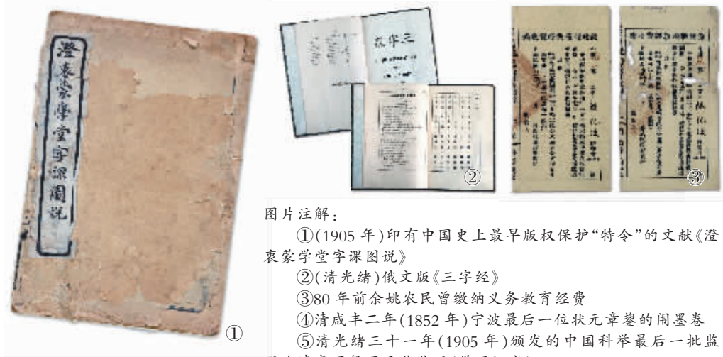
图片注解：①(1905年)印有中国史上最早版权保护“特令”的文献《澄衷蒙学堂字课图说》②(清光绪)俄文版《三字经》③80年前余姚农民曾缴纳义务教育经费④清咸丰二年(1852年)宁波最后一位状元章铤的闹墨卷⑤清光绪三十一年(1905年)颁发的中国科举最后一批监照晚清李国磐国子监监照(学历证书)

由于实体博物馆受时间、空间等客观条件的限制，同时建成了宁波教育网络虚拟博物馆（www.nb-edu-museum.cn）。通过互联网、多媒体与新形势技术，实现线上线下一体化、借助网络融入公众、内容持续增长，改变以往传统的博物馆展览方式，利用信息数据库、音视频、平面动画、虚拟三维等多种方式，通过三维呈现、人机交互等手段，向观众展现宁波教育的发展历史、重要任务、事件及相关文物，弘扬与传承宁波教育的优秀传统文化，使之成为能提供专项信息及检索服务的公益性教育平台，促进宁波教育博物馆与社会公众的沟通，加深人们对宁波教育博物馆的了解，提升宁波教育博物馆文化的影响与传播，努力建设成为“数字宁波”的一个重要文化窗口。