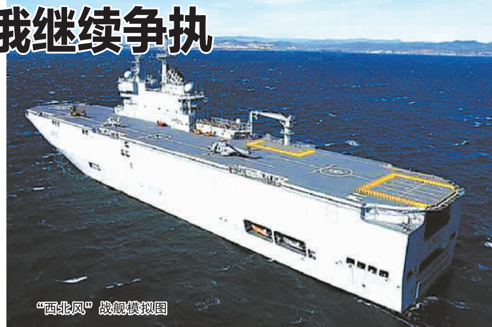
“西北风”战舰模拟图

法国媒体说,“西北风”的安保和检修工作每月花费法国政府数以百万计欧元。《观点》周刊14日报道,中断对俄军售可能最终令法国政府损失50亿欧元(57亿美元)。“取消订单后,法国政府不但不能给法国海军造船局和其承包商分别带来12亿欧元(15亿美元)和大约8.9亿欧元(10亿美元)利润,政府还将因未能履行合同赔付大约20亿(23亿美元)至50亿欧元(57亿美元)。”