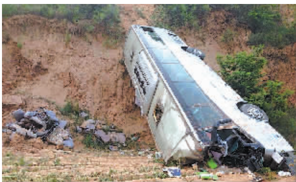
5月15日拍摄的事故现场。

记者从陕西省咸阳市淳化县有关部门获悉,5月15日下午,一辆大巴车在淳化县境内发生坠崖事故,已经造成33人死亡。15日15时27分左右,西安相帮商贸有限公司一辆大巴车在淳化县境内发生坠崖事故。据初步了解,车上乘客44人。