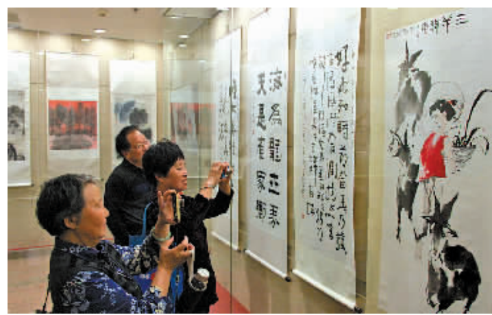
图为市民在邵洛羊艺术馆观赏展出的书画艺术作品。