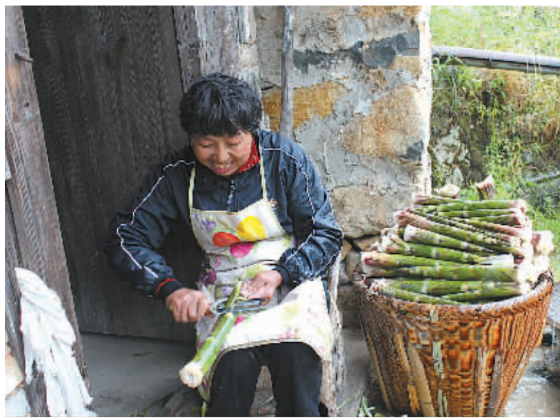
高田镇许家村倪家山村村民正在剥笋。

据了解,奉化有7000余亩鳊竹林,因鳊笋产量较低,每亩竹林只能产出约500斤鲜鳊笋,可制作100斤羊尾笋干,因此由鳊笋制作的羊尾笋价格略高。烤制好的羊尾笋将销往宁波、杭州等地的市场。