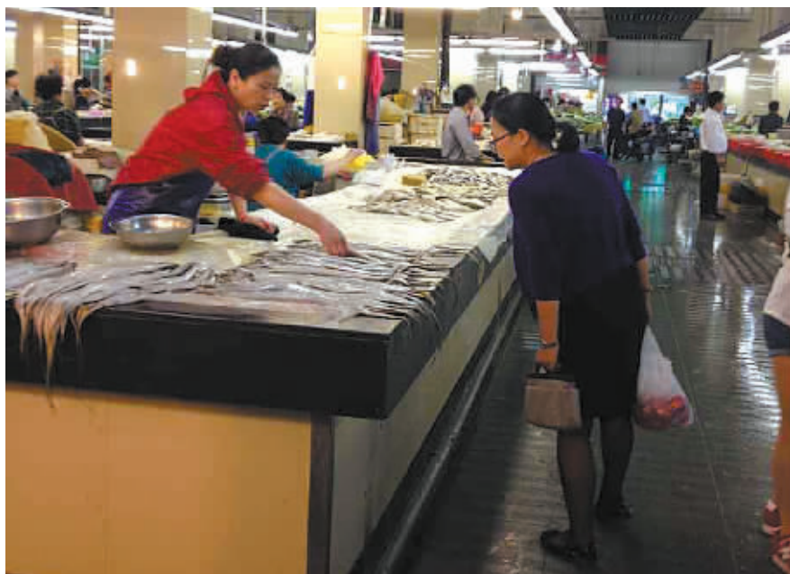
手机支付走入甬城传统菜市场尚需时日。

当记者把支付宝这一消息告诉菜场方面,无论是管理者还是经营户,都感到很意外。“如果不是你跟我说这件事,我还没听说过。”华严菜市场场长余信国坦言,自己平时并不网购,对手机钱包一无所知。据他了解,整个菜场200多个摊位,五六百位经营户,