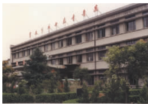
1985年开诊时的门诊楼

1975年的一个寒冷冬季，有一家医院在甬城悄然崛起，这就是宁波市妇女儿童医院的前身——宁波地区医院。1980年，宁波地区医院正式开诊。1983年因地市合并，医院改名为宁波市明州医院，1985年在明州医院的基础上与宁波市第一医院儿科、宁波市第二医院妇产科整合孕育出现现在的宁波市妇女儿童医院。 循着历史的足迹，医院走过的每一步，都深深地铭刻在妇儿人的心里：1993年4月23日，医院增设宁波市红十字医院，同年获国家级“爱婴医院”称号；1998年，医院增设宁波市妇幼保健院；2003年10月27日，医院增设宁波大学医学院附属宁波市妇女儿童医院；2006年1月15日，省卫生厅发文公布医院为三级乙等妇幼保健院；2010年8月，医院新住院大楼启用，开放床位952张；2010年10月9日，北部院区在江北慈城奠基；2011年5月30日，北部院区一期工程开工建设；2011年7月18日，省卫生厅发文公布医院为三级甲等妇幼保健院；2013年3月28日，南部院区儿科大楼开工建设；2014年1月18日，北部院区门诊急诊运行，截至11月开放床位303张；2015年2月16日，医院总核定床位1500张，其中南部院区900张，北部院区600张。