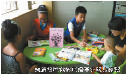
志愿者在候诊区陪伴小患儿阅读

风雨不变的坚守书写了一条大爱无疆的医者之道，始终如一的服务诠释了一颗为民服务的赤子之心。