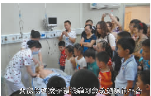
为家长和孩子提供学习急救知识的平台

积极承担突发公共卫生事件的救治任务，履行社会责任。宁波市妇儿医院积极响应上级号召，2008年、2009年连续两年派出医疗队分别支援安徽阜阳、河南商丘的手足口病防治工作，成功抢救多例危重患儿，并培训了当地医护人员，出色地完成支援任务，受到了卫生部、当地政府的表扬和我市各级部门的嘉奖。“5.12”汶川特大地震后，医院又先后派出4批次共6名医护人员赴四川灾区对口支援灾后医疗重建工作，医院儿科和多名医护人员被评为市级抗震救灾先进集体和先进个人。目前已有8位医生圆满完成援非医疗任务回国，受到当地政府和人民的高度肯定和赞扬。还有2名妇产科医生完成新疆阿克苏地区库车县支援任务，2名儿科医生完成西藏那曲地区比如县医疗支援工作。