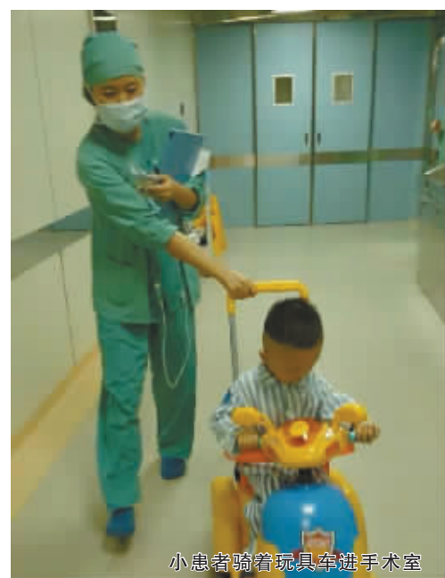
小患者骑着玩具车进手术室