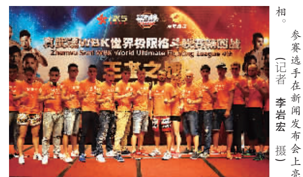
参赛选手在新闻发布会上亮相。

真武魂的比赛除在赛场电视播出外，本站比赛将在湖南经视直播。此外，腾讯视频等将对今晚的比赛进行网络直播。