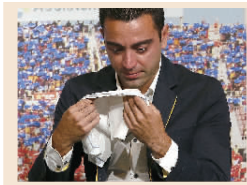
哈维在告别仪式上洒泪道别。

本报讯（记者姬联锋）宁波银博足球俱乐部落户大榭的新闻发布会昨天下午在大榭开发区举行。上个月底，球队正式改名为宁波大榭银博足球俱乐部有限公司，注册地址变更为大榭开发区。