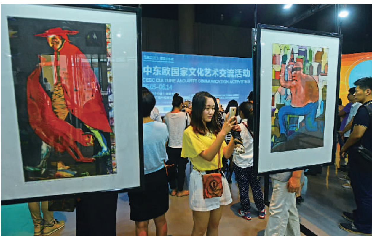
昨天上午，市民在中东欧国家文化艺术交流活动中欣赏展品。

首先登场的是中国—中东欧国家合作发展论坛，将于6月8日在南苑环球酒店举行。围绕共建“一带一路”的主题，我国与中东欧16国的政要将在论坛上作主旨发言，演讲嘉宾包括中东欧有关国家的副总理、部长、副部长，以及我国国务院领导、部委和省市领导。来自中东欧国家的政府代表、驻华使领馆代表、机构及参展商代表、中方政府代表、专家、