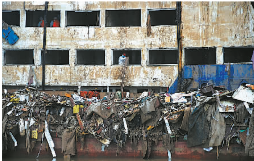
近日,湖北省军区某舟桥旅对“东方之星”船体进行了全面的清理工作,截至6月8日,已经清理遗物1500余件,杂物200余吨。

据新华社6月8日电 “东方之星”客船翻沉事件前方指挥部消息,8日上午,现场搜寻人员又搜寻到2名遇难者遗体,遇难人数升至434人,加上生还者14人,目前失踪人员还剩8人。