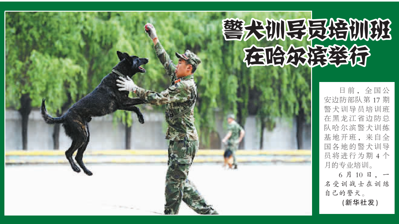
日前,全国公安边防部队第17期警犬训导员培训班在黑龙江省边防总队哈尔滨警犬训练基地开班,来自全国各地的警犬训导员将进行为期4个月的专业培训。