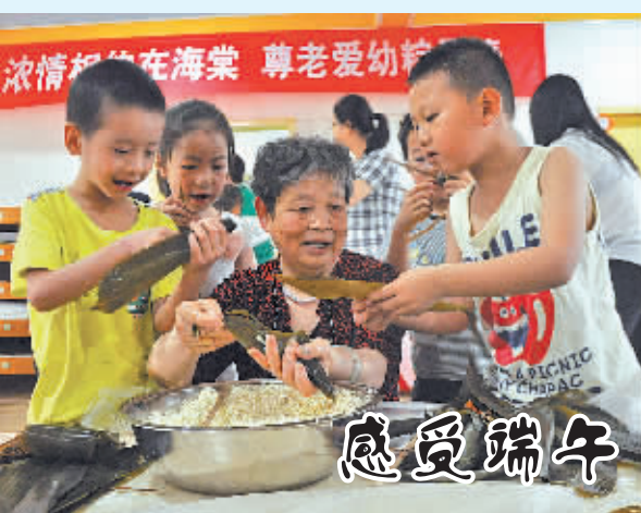
6月11日上午,北仑新碶街道海棠社区的几位老奶奶,来到北仑区中心幼儿园,教小朋友包粽子。这些粽子届时会送给社区的困难家庭和独居老人。