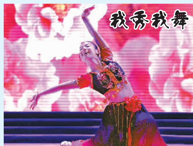
6月11日,鄞州区总工会举行“我才我秀”职工才艺比拼决赛,评出10名最佳才艺奖。图为区教育工会选手正在表演独舞《花儿》。