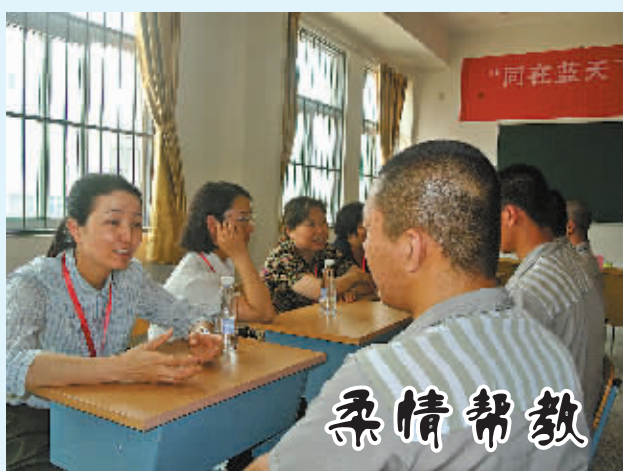
6月12日下午,海曙法院几位女法官以及市律师协会的部分女律师,来到市望春监狱,一对一地对部分服刑人员进行帮教和心理疏导。