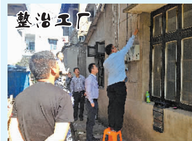
一楼生产经营,二楼住人,这种“三合一”、“多合一”的小厂在慈溪白沙路街道有不少,该街道经过专项整治,共督查合用场所332户,查找解决问题39项,图为检查现场。