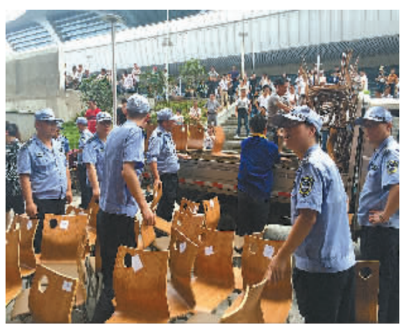
图为执法人员正在查处违规快餐店。

徐所长表示，下一步，他们将督促被暂扣工具的店家主动与社区联系，配合相关的烟道改造工作，并在许可范围内合法经营，尽可能减少油烟的产生，还居民一个健康舒适的生活环境。