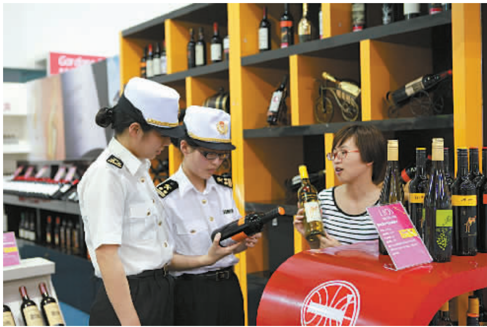
宁波海关关员在进口商品市场了解进口商品销售情况。

澳大利亚和韩国是亚太地区的重要经济体,也是宁波的重要贸易伙伴。据宁波海关统计,1-5月宁波对澳大利亚进出口贸易额达92.3亿元,列十大贸易伙伴第7位,其中进口49.9亿元,主要以铁矿石及其精矿为主,出口42.4亿元,主要商品为机电产品、纺织服装和塑料制品。韩国也是宁波前十大贸易伙伴之一,2014年宁波对韩国进出口贸易额为42.88亿美元,占全市外贸总额的4.1%,其中