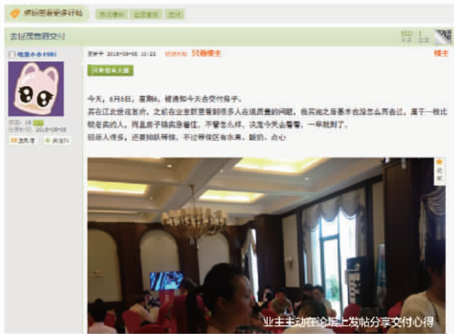
业主主动在论坛上发帖分享交付心得

业主感受到开发商的诚意,加之江北实验小学学区的确定,业主开始期待交付,期待住进小区的未来。而之前一次又一次的沟通成为了首府顺利交付的基石。交付后,有很多业主自发在各大网络、论坛为首府点赞,对社区的喜欢溢于言表。