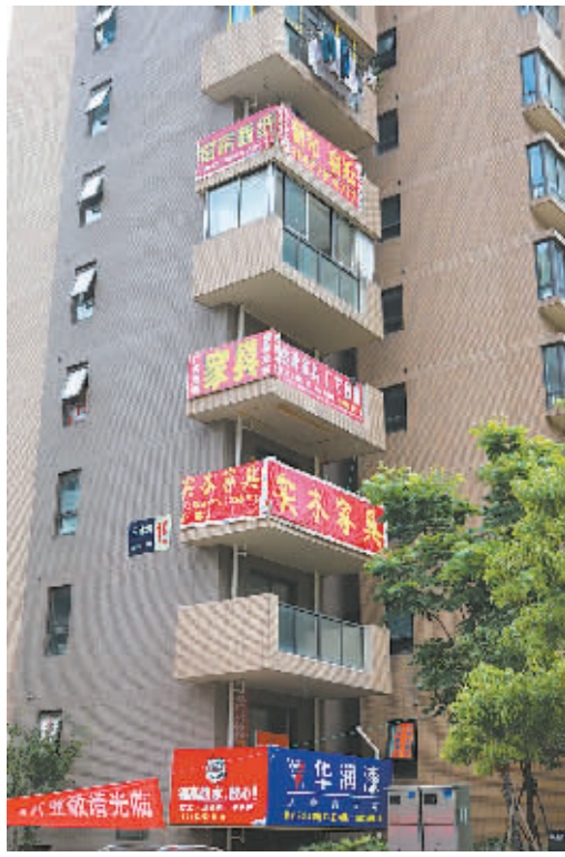
阳台成了“当红”广告位。

小区的管理，需要物业、业主劲往一处使。陈总经理说，预计到10月份，第一波装修高峰会慢慢降温，陆续有居民搬进来，这些广告板也会基本清理干净。目前，“三水湾”的社区居委会正在筹建中，物业公司下一步打算发起文明倡议书，通过楼道小组长以及村里一起做工作，呼吁业主自律，共同把乱悬挂、张贴的广告清理干净，创造一个良好的居住环境。