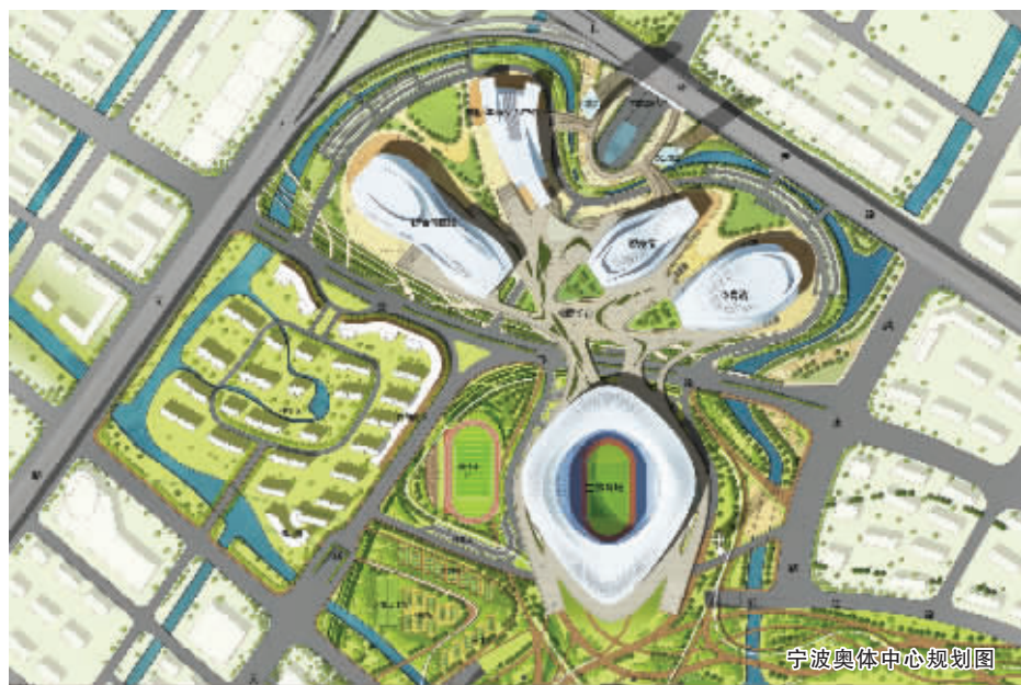
宁波奥体中心规划图