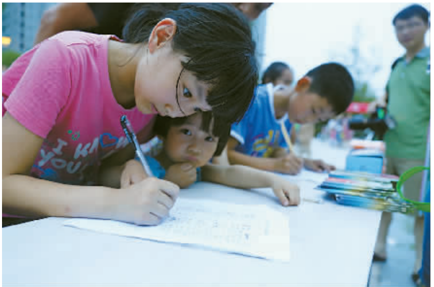
6月27日晚,余姚市凤山街道东江社区举行了小手拉大手,文明齐步走,全民共建“美丽家园”活动的启动仪式,60余名孩子在家长陪同下,踊跃报名参加美丽家园“小卫士”的招募。