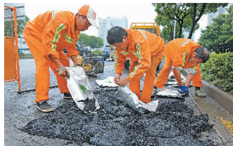
昨天下午，在鄞县大道—钱湖北路路口，鄞州区城管局市政公用管理处施工人员首次尝试防水沥青修补破损路面。该局利用普通沥青与防水沥青相结合的方式，对存在安全隐患的破损道路进行集中修复，7天时间共维修坑洞面积332平方米。

慈溪 本报讯(项一 钦 周敏杰 叶爽)自7月4日中午起，慈溪平原出现大到暴雨，截至7月8日15时，慈溪全市面