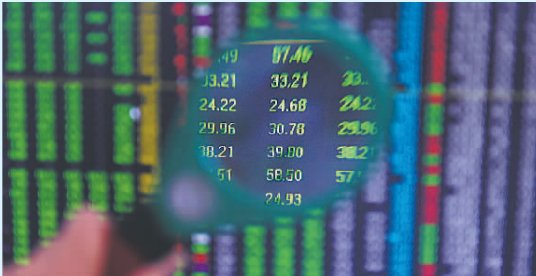
7月8日，沈阳一位股民在用放大镜观看股市行情。

昨日，上证综指跌5.90%，勉强守住3500点；深证成指跌2.94%；创业板指数率先止跌，收盘点位较前一交易日涨0.51%。