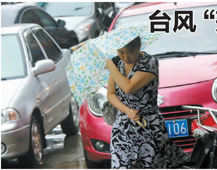
7月9日,市民在汕头街头冒雨出行。