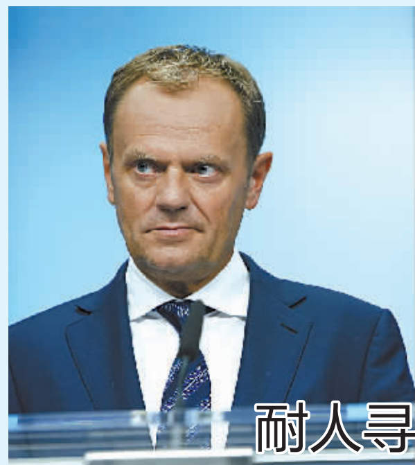
7月13日，在比利时首都布鲁塞尔，欧洲理事会主席图斯克在欧元区领导人峰会结束后出席新闻发布会。