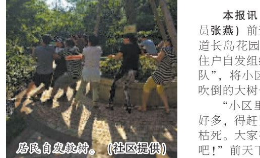
居民自发栽树。

小区的业主QQ群里发起倡议,立即得到众多业主的响应,不一会儿,小区中庭里就聚集了100多名业主。