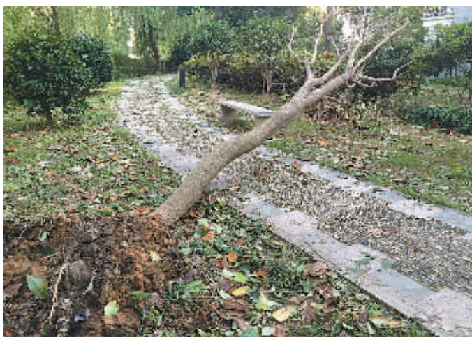
图为“桂花园”里倒伏的大树。

鄞州城管局园林绿化管理处相关负责人介绍,倒伏树木进行回种,先要进行修剪,再根据土壤情况尽快回种。像这次,部分绿地或