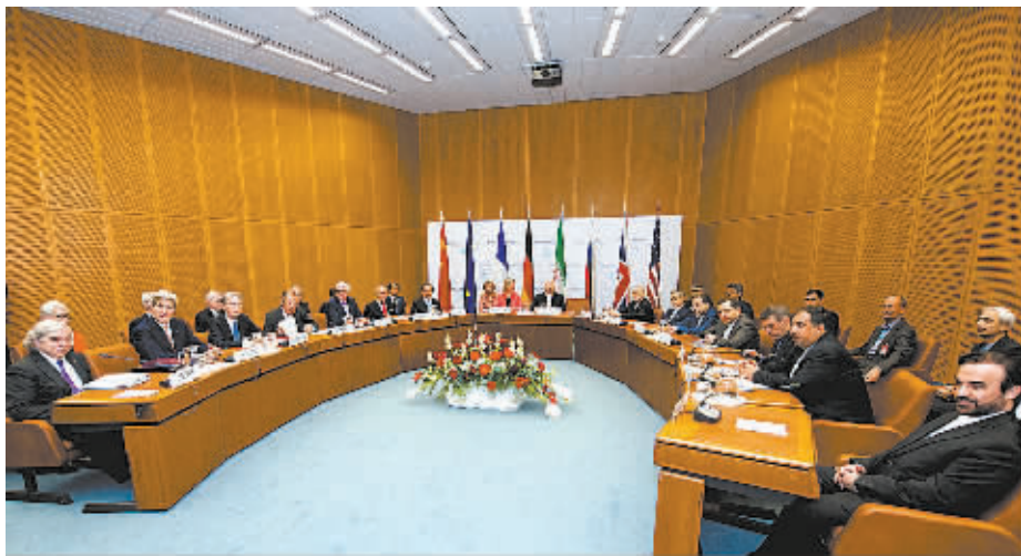
7月14日,在奥地利首都维也纳联合国中心,各方代表出席全体会议。

盖里尼说,伊朗核问题最终协议的达成,开启了“国际关系的新篇章”,说明通过外交协调和合作,可以克服数十年的紧张关系和冲突对立,对整个世界来说也是“希望的信号”。