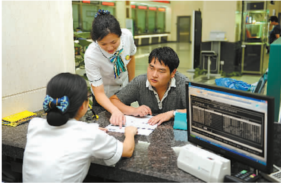
日前,农业银行宁波市分行的业务员正在为消费者提供理财服务。

宏信证券研究员徐伟预计,大额存单对定期存款和银行理财产品有一定的替代作用,但目前利率水平定的不高,短期影响并不明显。