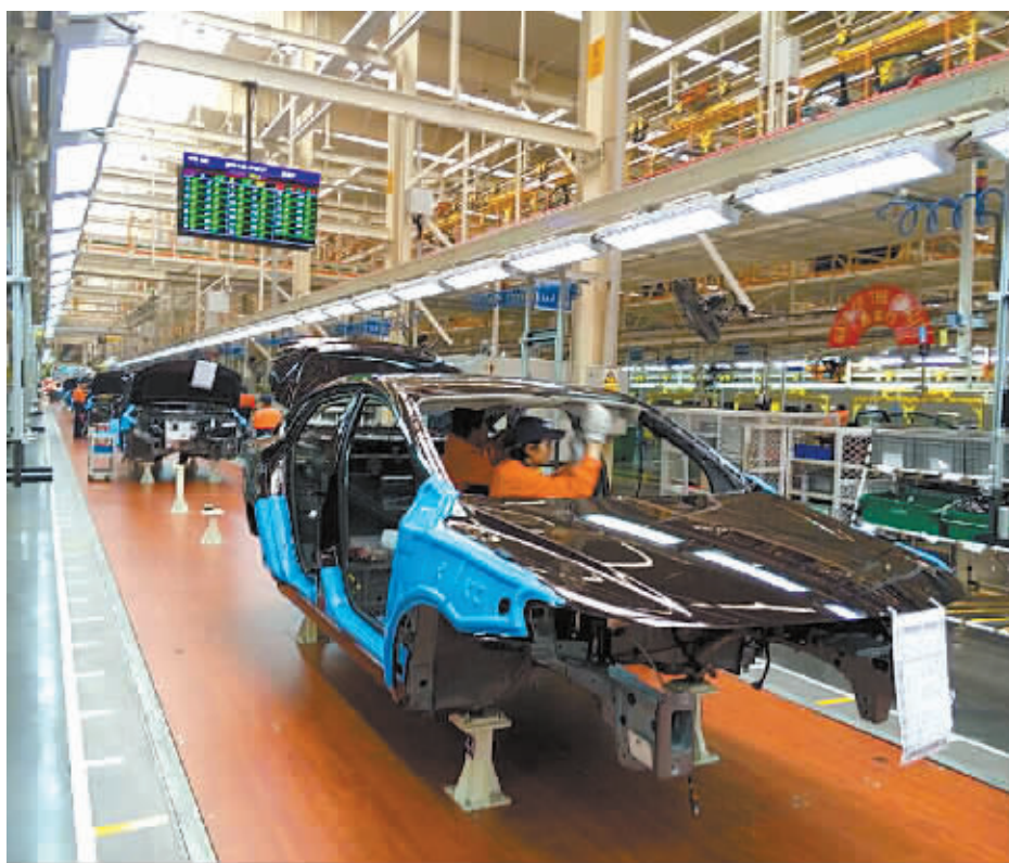
吉利汽车整车制造流水线。

企业只有掌握核心技术,参与制定国际、国家标准,才在技术创新上拥有更多话语权、定价权、主动权,进一步提升企业竞争力和市场占有率。多年的制造业百强企业拥有国家级技术中心 11 家,省级技术中心 54 家,市级技术中心 20 家。已有 63 家企业参与国际、国家技术标准的修订。另外,制造业百强中,拥有国家级驰名商标 57 个,省级著名商标 78 个,市级