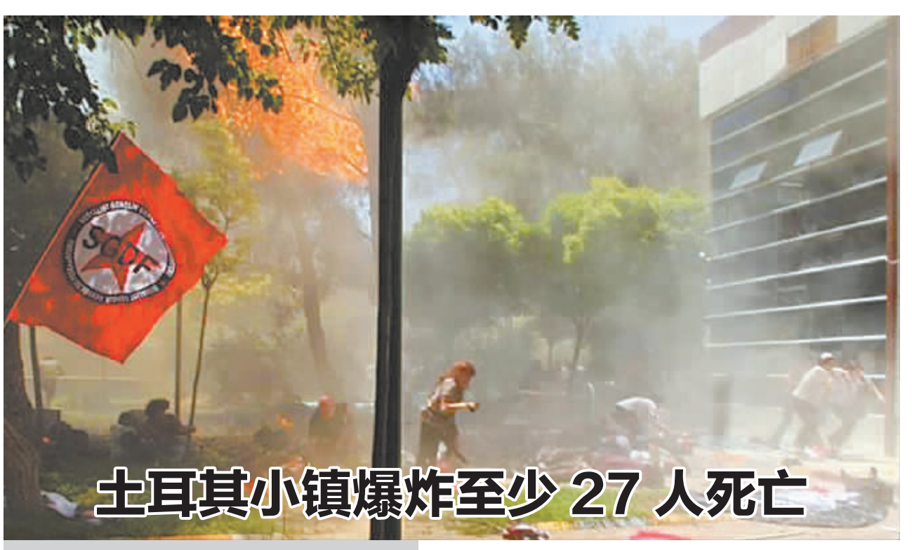
土耳其小镇爆炸至少27人死亡

伊图尔韦曾在古巴驻联合国代表团工作14年,先后出版过十余部关于古美关系的著作。他说,阻碍古美两国关系正常化的另一障碍是美国1966年颁布的《古巴调整法案》,这一法案规定古巴非法移民一旦踏上美国领土,就可以合法寻找工作并领取经济救助。“美国执意维持《古巴调整法案》这一鼓励非法移民的政策,这又是一个有待解决的问题。”