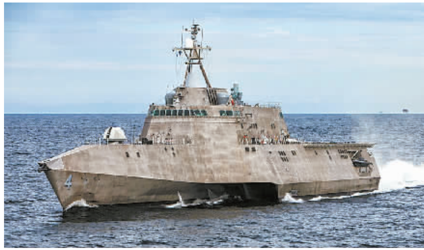
濒海战斗舰根据美国海军所谓“任务模块”理念设计,可根据分配的任务不同而快速转换。这种舰只有核心船员大约50人,但可根据任务搭载97人。图为美军濒海战斗舰LCS-4“科罗拉多”号。(资料图片)

美国海军少将、濒海战斗舰项目执行官布赖恩·安东尼奥18日说,随着美国海军增加在南中国海地区的存在,2018年之前将向新加坡派驻4艘濒海战斗舰。