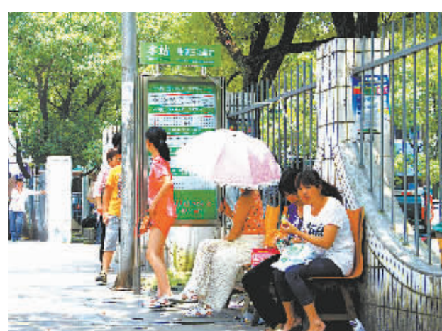
图为乘客坐在木椅上候车。

本报讯(记者余建文 奉化记者站凌青 通讯员徐晨光)最近,奉化85岁的谢勇良老人做了一件令人翘指称赞的事:他耗时3个多月,打造了13把长椅,安放到7个公交车站,给候车人休息用。谢勇良家住奉化莼湖应塘路,当了40多年木匠。今年3月,奉化城区与莼湖的公交线路开通,老人发现公交车站没有椅子,就萌生了自己动手定制的想法。老伴周阿姨说,他们老两口平时去镇里的老年学校,偶尔也要去奉化城里,要搭公交车,“给车站做几把椅子,自己候车时能坐坐,也给别人提供方便。”老人的想法很朴素。候车的乘客听说椅子是80多岁的老木匠亲手打制的,惊讶之余,无不由衷夸赞:这个“板凳爷爷”真是个好人啊!