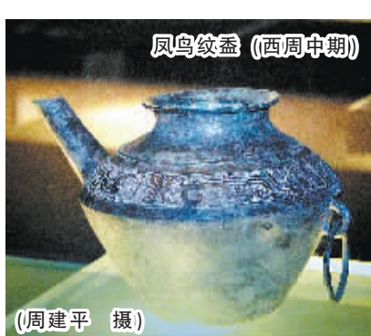
凤鸟纹盃（西周中期）