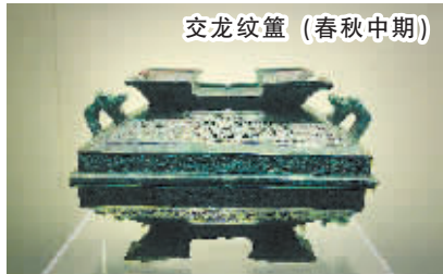
蛟龙纹盃（春秋中期）