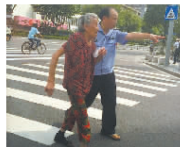
@陈林 南爱H: 在来福士广场门口人行道看到有爱的一幕,正能量!