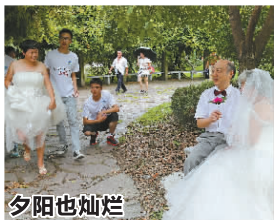
安丰社区党员志愿者近日为社区75周岁以上的金婚夫妇免费拍摄婚纱照,他们穿上婚纱西服,重温当年结婚时的情景。此次活动有20多对夫妇参加,社区居民纷纷为此点赞。

据了解,比赛即将进入下一阶段,邀请投资人和专业人士对项目进行网评、审核,并与参赛者进行沟通。