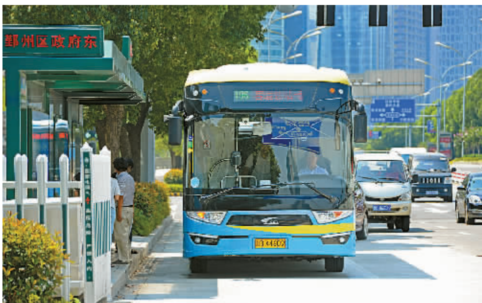
因为投入运营的超级电容储能式现代电车。

万一遭遇堵车,会不会影响行驶?“不会。”杨颖说,超级电容储能式现代电车有辅助电池,以备不时之需。宁波供电公司沿线路安装了4台400千伏安、2台200千伏安变压器为充电站供电,始末站也采取双电源供电,保障车辆正常运行。