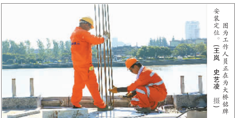
因为工作人员正在为大江桥牌安装定位。

“桥梁主体已经完工，正在进行桥体外立面装饰。”建设单位市政工程公司项目负责人廖经理介绍，大桥的装饰非常有特色，是个精细活，装饰班组40余人从去年12月开始施工，至今完成了约八成。记者看到，桥梁侧面均已铺挂上淡蓝色泽石材，立面凹凸有致，呈现极强的立体感。拱形桥梁上方，是一溜多重拱门装饰，外观与