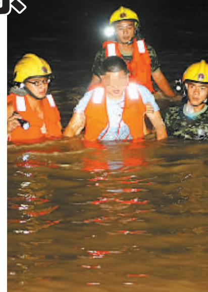
图为救援现场。